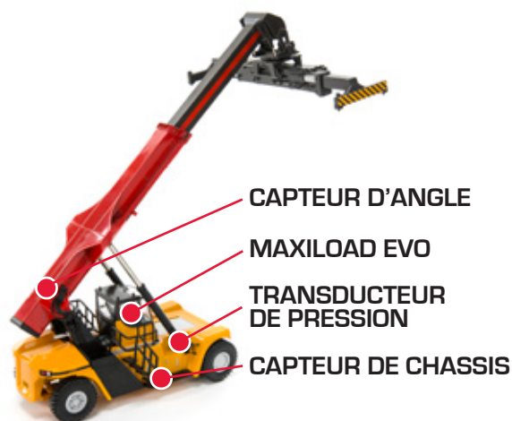
Chariot élévateur télescopique / porte conteneur